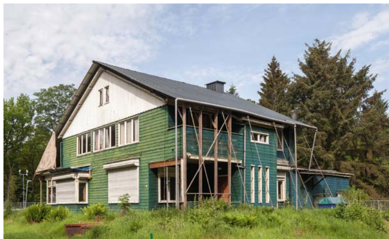
Houten dienstwoning met erker, Schattenberg 4, in Kamp Westerbork te Zwiggelte. W. van der Sar 2014

Het woord erker is afgeleid van arkel en dat komt weer van het oud-Frans 'arquiere' [schietsgat]. Het werd waarschijnlijk ergens in de negentiende eeuw in onze taal geïntroduceerd. Welke term voorheen werd gebruikt, is niet helemaal duidelijk. In de zeventiende eeuw komen we de term hangkamers tegen. Misschien werden benamingen als arkelraam of arkelvenster gebezigd?